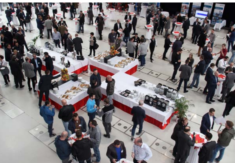
Der Glagtag für die CLIMAplusSecurit-Partner in Linz hat die Zukunft smarter Glas-Fassaden ausgelotet. Die Branche geht davon aus, dass die digitale Transformation diesem Markt einen Schub geben wird. Seite 52