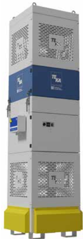
Die Plug & Play-Absauganlage CleanAir-Cube präsentiert Teka mit neuer, leistungsstärkerer Motorentechnik.

Die Absaug- und Filteranlage CleanAir-Cube ist eine Standalone-Anlage mit Einwegfiltern. Sie eignet sich vor allem für Industriebetriebe wie Schweißereien, in denen Stäube und Nachrauche kurzzeitig verstärkt abgesaugt werden müssen. Zur Blechexpo präsentiert Teka die Anlage in neuem Produktdesign und mit neuer, leistungsstärkerer Motorentechnik. So beträgt der maximale Volumenstrom 8.000 m 3 /h bei 550 W. Die Anlage ist in der Lage, leichte, trockene Stäube großflächig aufzunehmen und zu filtern. Dabei arbeitet sie nach dem von der Berufsgenossenschaft empfohlenen Schichtlüftungsprinzip. Hierbei saugt die Anlage die schadstoffhaltige Luft an der Geräteoberseite ein und führt die gereinigte Luft nach dem Filterprozess über Austrittsöffnungen an allen vier Seiten des Geräts in den Arbeitsbereich zurück. Auf diese Weise wird dem Raum wieder saubere Luft zugeführt.