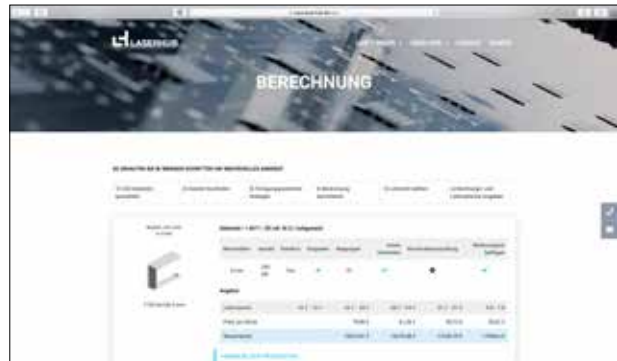
Neue Service-Funktionen erfüllt die Cloud-basierte Online-Plattform für Beschaffung und Auftragsmanagement von Laserhub.

Das Lorch Cobot Welding Package besteht aus einem Roboter, der zugehörigen Software und der Schweißanlage samt Hochleistungsbrenner. Der Hersteller garantiert, dass der Roboterarm dank eingebauter Sensorik bei einfacher Berührung sofort stoppt. So kann der Schweißer ohne aufwändige Schutzeinrichtung direkt neben und mit dem Roboter arbeiten. Als weitere Vorteile werden das geringe Eigengewicht des Roboters von knapp 30 kg und die einfache Bedienung genannt, die es erlaubt, auch ohne größere Programmierkenntnisse Schweißvorgänge zu automatisieren. Werkstückdaten wie Blechstärke und Basismaterial werden über das in der Software integrierte Assistenzsystem eingegeben, Parameter wie Schweißstrom und Schweißgeschwindigkeit werden automatisch berechnet. Der Schweißroboter eignet sich sehr gut für die Serienfertigung und entlastet Schweißer von monotonen Routineaufgaben.