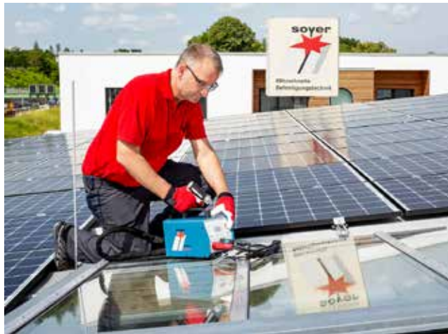
Die beiden tragbaren Bolzenschweißinverter BMS-9 ACCU und BMK-8i ACCU von Soyer.

Zur aktuellen Produktpalette von Soyer zählen die beiden akkubetriebenen Bolzenschweißer BMS-9 ACCU und BMK-8i ACCU. Sie wiegen 7,2 kg bzw. 8,0 kg. Bei Bedarf lässt sich der Akku durch ein externes Ladegerät (beim BMS-9 ACCU) bzw. durch ein fest integriertes Lademodul (beim BMK-8i ACCU) aufladen. Die tragbaren Bolzenschweißgeräte zeichnen sich laut Hersteller durch einfache Handhabung, Bedienbarkeit, sehr gute Ergonomie und geringen Energieverbrauch aus. Durch das geringe Gewicht und die auf Arbeitskomfort konzipierte Bedienfunktion