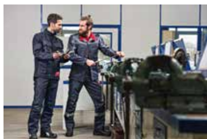
CWS by CWSboco

Die Kollektionen mit Schweißerschutz der Klasse 1 proFlex4 Essence und proFlex4 Advanced bestehen aus einem leichten, reiß- und schnittfesten Hightech-Gewebe. Dieses isoliert gegen einwirkende Hitze und Störlichtbögen und verhindert zudem