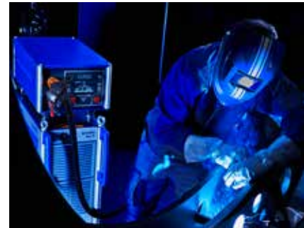
Die MSG-Schweißstromquelle Qineo Next von Cloos.

Im Handschweißbereich können die Fachbesucher die Qineo-Modellreihe begutachten, insbesondere die Qineo Next. Diese MSG-Schweißstromquelle verfügt laut Hersteller über sehr gute Lichtbogeneigenschaften; ihr modularer Aufbau ermöglicht vielseitige Einsatzvarianten. Zudem wird auf dem Messestand die Prozessfamilie MoTion Weld für das automatisierte MIG/MAG-Schweißen präsentiert. Der Energieeintrag in das Werkstück ist steuerbar, die Spritzerbildung bei gleichzeitig hohen Schweißgeschwindigkeiten minimiert. Damit eignen sie sich vor allem für Anwendungen im Dünnblechbereich. Weitere Messeneuheit ist das Gateway C-Gate, ein Informations- und Kommunikationstool für das Management von Schweiß- und Roboterdaten. Das System besteht aus der anlagennahen Hardware und verschiedenen Softwaremodulen. Mit dem Produktionsmodul lassen sich die Performance und Wirtschaftlichkeit von Roboteranlagen darstellen.