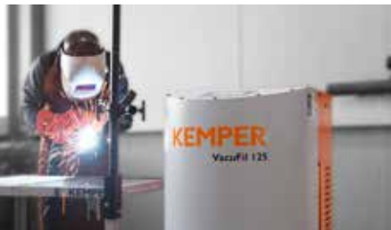
Im Fokus des Messeauftritts steht das mobile Absauggerät VacuFil.

Einen Messeschwerpunkt legt Kemper auf die Pistolenabsaugung für Schweißanwendungen. Im Fokus steht hier die VacuFil-Produktfamilie für mobile Absauggeräte an Einzelarbeitsplätzen. Darüber hinaus zeigt der Hersteller einen nachrüstbaren Hochleistungsfilter.