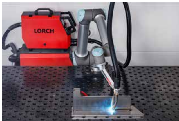
Der Cobot eignet sich sehr gut für die Serienfertigung und entlastet Schweißer von monotonen Routineaufgaben.