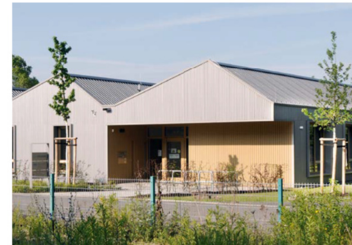
Vier Firmen in Weimar haben sich entschlossen, einen Betriebskindergarten nach KfW-Effizienzhaus 55 zu bauen. Dach und Fassade kleidete Fassaden Schneider aus Weimar in Metall – das Auftragsvolumen umfasste 200.000 Euro. Seite 18