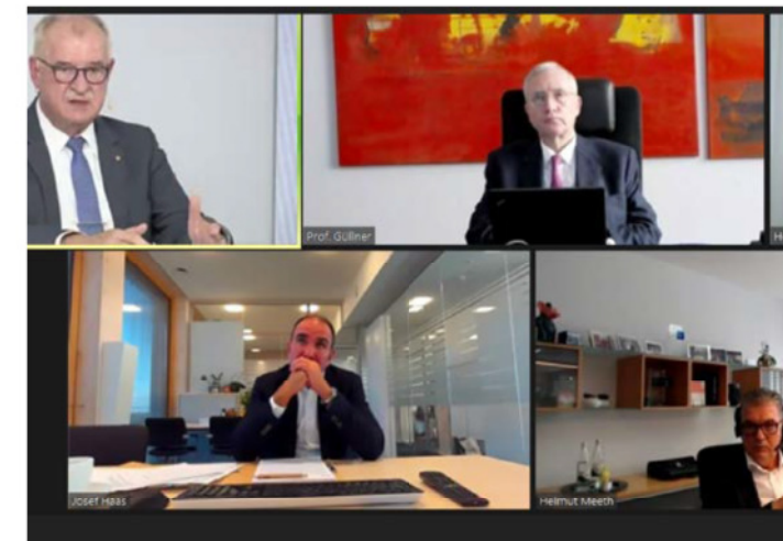
Die jährliche Fachpressekonferenz von Roto Frank fand dieses Jahr digital statt. Mit viel Einsatz ist die Gruppe bemüht, sich dem negativen Trend durch die Corona-Krise zu entziehen. Die Bilanz zum Jahr 2020 lesen Sie auf Seite 13