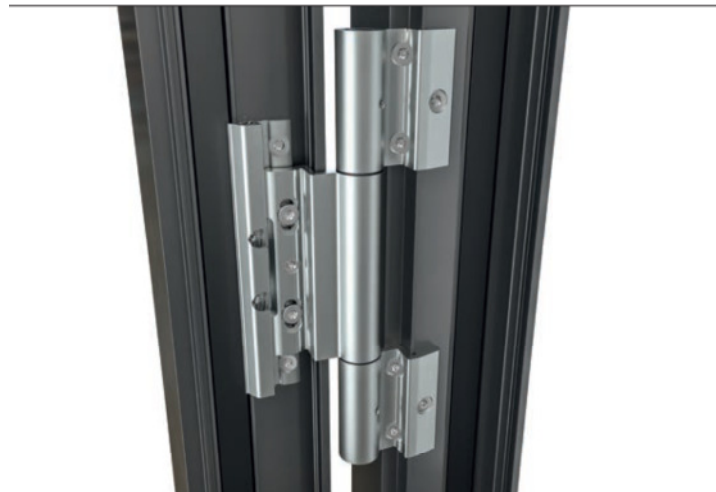
Inwiefern hat sich die Beschlagtechnologie für Türen verändert? Was muss der Verarbeiter über moderne Beschläge wissen? Welche Nachrüstlösungen gibt es? Die Antworten lesen Sie auf Seite 30