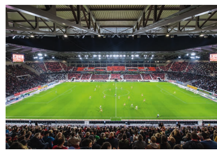
Das Europa-Park Stadion in Freiburg ist ein Beispiel par excellence, wie konstruktiver Stahl- und Aluminiumbau ein Objekt in seiner Architektur prägen können. Wir haben uns sowohl beim Stahlbauer als auch beim Metallbauer informiert. Die Berichte finden Sie ab Seite 40