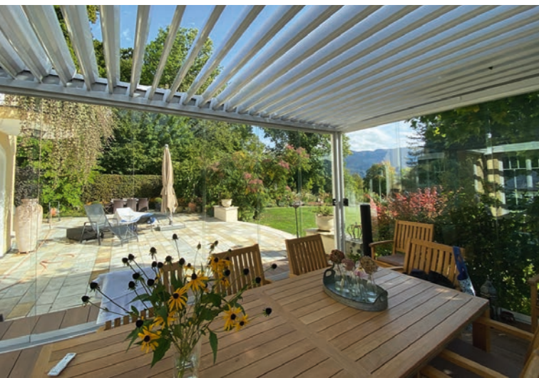
Lamellendächer für Terrassen haben sich zu einem Trendprodukt entwickelt, herkömmliche Markisen hingegen sind inzwischen wohl weniger gefragt. Über das Marktpotenzial Sonnenschutz lesen Sie ab Seite 6