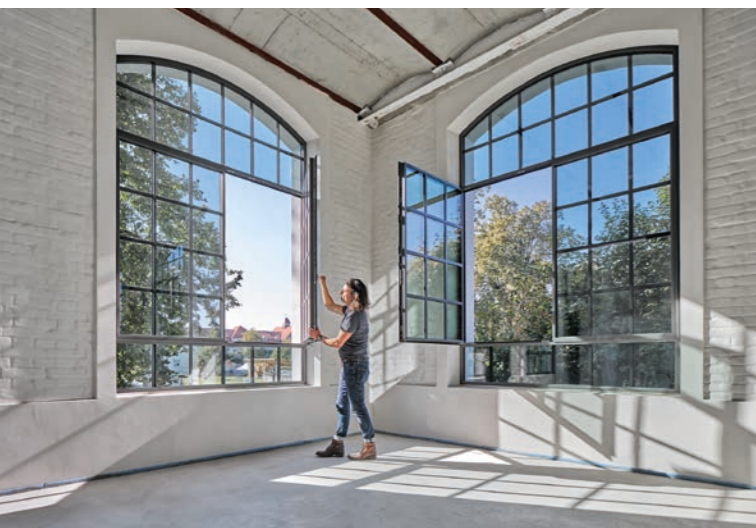
Die Sanierung der vollflächigen Industrieverglasung der Neuen Spinnerei in Wangan forderte eine anspruchsvolle Rekonstruktion. Metallbauer Wolfgang Forster hat auf den Charakter des Gebäudes geachtet. Seite 46