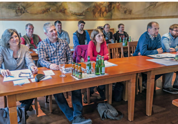
Die DIN 18008 fordert vielfach Berechnungen, die sich am einfachsten mit einer Software erledigen lassen. Der Softwareentwickler MKT bietet das Programm Glastik. metallbau war bei einer Schulung dabei. Seite 22