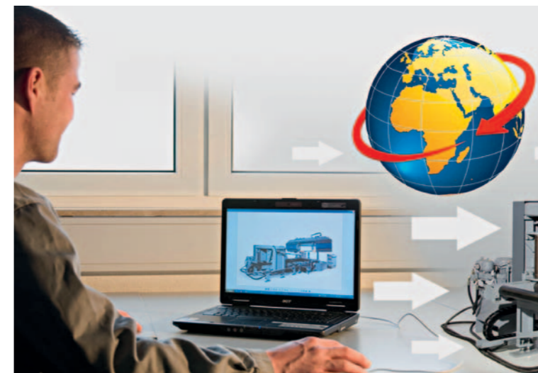
Viele Hersteller haben für ihre Maschinen ausgereifte Strukturen für die Wartung über den Tele-Service, aber die Metallbauer sind eher skeptisch. Wir berichten über praktische Möglichkeiten, inwiefern sich der Maschinenservice aus der Ferne steuern lässt. Seite 68